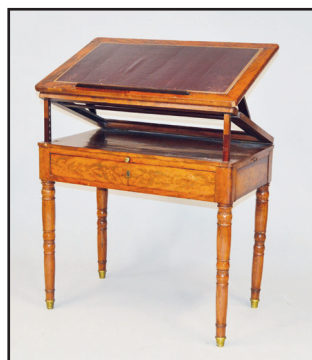
Table à la Tronchin en noyer et placage de noyer. Plateau orientable recouvert de maroquin marron, doré aux petits fers. Pieds tournés. Epoque Louis Philippe. (fentes au plateau, sautes de placage) H. 74 L. 89 P. 54 cm 300/400