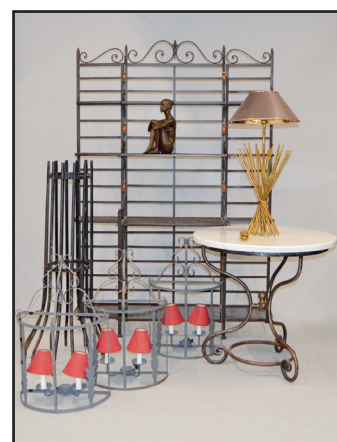
D'un ensemble de mobilier en fer forgé