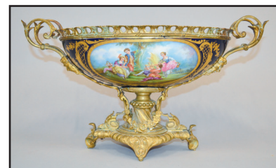
Genre de Sèvres - Grande jardinière ovale en porcelaine polychrome et or à fond bleu. Monture en bronze. Style Louis XVI, vers 1900. H. 26 L. 75 P. 25 cm 500/600

Lots visibles sur www.palais-svv.fr et www.gazette-drouot.com