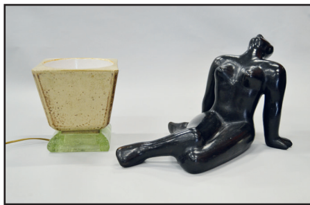
Travail FRANCAIS, vers 1950 - Lampe quadrangulaire en céramique émaillée beige. Base en verre bûlé. H. 22 cm 250/280 Travail FRANCAIS, 1950-60 - Femme assise en céramique émaillée noire. H. 30 L. 51 cm 400/500