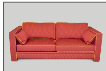
NOBILIS et FIRST TIME, Designer Didier GOMEZ - Grand canapé moderne trois places entièrement tapissé de tissu Nobilis épais rouge et or. H. 80 L. 209 P. 93 cm 450/500