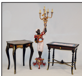
Table de salon en bois noirci et marqueterie Boulle à décor de rinceaux, pieds cambrés. Style Louis XIV, vers 1900 (accidents et manques) H. 77 L. 62 P. 49 cm 150/200 Lampadaire-torchiere en bois sculpté et polychrome à décor d'un page noir tenant une corne d'abondance. Style Napoléon III, XXe siècle. H. 177 cm 250/300 Table de salon en bois noirci à plateau en céramique à décor de polychrome de griffons affrontés et rinceaux sur fond rose (plateau restauré). Pieds tournés. Epoque Napoléon III H. 74 L. 74,5 P. 44,5 cm 180/200