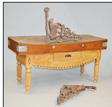
Billot de boucher en bois ouvrant à un tiroir. Montants sculptés. H. 85 L. 169 P. 59,5 cm 600/800 Paire de porte-enseignes de boucherie en fonte à décor de boeufs. 71 x 57 cm 250/300

17, rue Pétrus Maussier 42000 Saint-Etienne