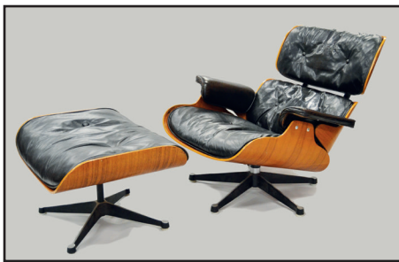
Charles et Ray EAMES, Edition Herman MILLER - Longe chair n°670 et son ottoman n°671 en placage de palissandre et cuir noir. Pieds en fonte d'aluminium (état d'usage, petites sautes de placage en bordure) H. 75 L. 85 P. 85 cm. Ottoman : H. 41 L. 65 P. 55 cm 2600/2800