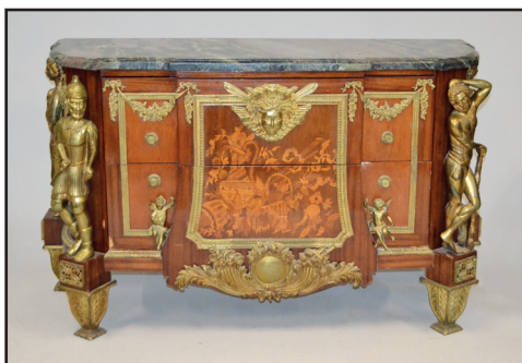
Commode en bois de placage et marqueterie ornée de bronzes à décor de figures mythologiques, d'après RIESENER pour la chambre de Louis XVI à Versailles. Plateau de marbre gris veiné. Style Louis XVI, XXe siècle. H. 89 L. 142 P. 52 cm