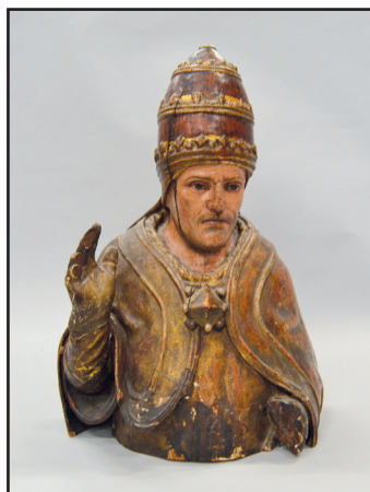
Buste de Pape en bois sculpté polychrome. XVIIe siècle. (manques aux doigts). H. 53 cm 500/600