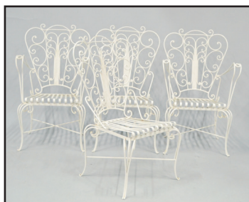
Salon de jardin comprenant deux fauteuils et deux chaises en fer forgé, laqué blanc. Assise lame de ressort. H. 95 cm 350/400