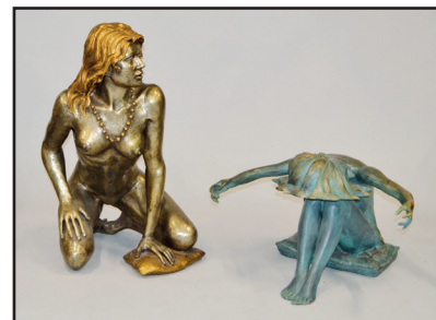
Travail MODERNE XXe siècle «Jeune femme nue accroupie» Sculpture en bronze à patine argentée et or. Porte sur la base une marque Lucille. H. 91 cm 600/800 Travail CONTEMPORAIN, vers 1980 «Danseuse assise les bras écartés, tête baissée» Sculpture en bronze à patine verte formant base de table basse. H. 47 L. 68 P. 74 cm 500/600