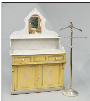
Coiffeuse provençale en bois laqué crème et filet bleu surmontée d'un plateau à étagère en marbre blanc enchassant un miroir. Vers 1900. H. 170 L. 108 P. 51 cm 500/600 Valet de nuit en métal chromé. Piètement à doucine circulaire. H. 150 cm 200/300