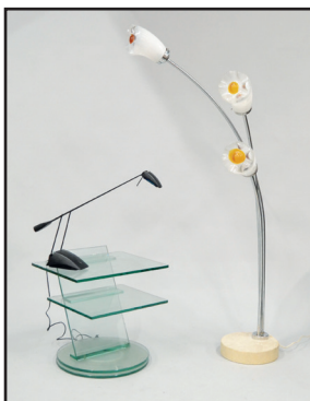
Table basse de salon tournante en verre sécurit à deux plateaux. Base circulaire. H. 61 L. 60 P. 53 cm 120/150 International Design - Lampe de bureau articulée en plastique noir. Vers 1980-1990. L. 80 cm 50/60 Travail MODERNE XXe siècle - Lampadaire de salon à trois bras de lumières articulés avec tulipe en verre moulé blanc et jaune à décor de fleurs. Base en marbre beige. Vers 1980. H. 180 cm 150/200