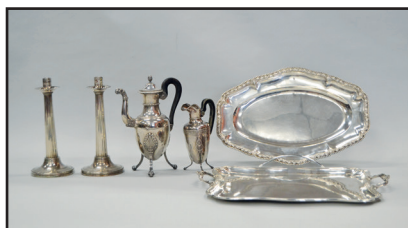
D'un ensemble d'argenterie : Paire de bougeoirs en argent. MO. T. Epoque Empire. Cafetière en argent. MO E. A. COURTOIS. XIXe s. Pot à lait en argent MO. JP BIBRON. Epoque Empire