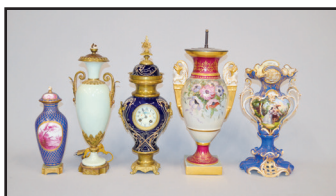
D'un ensemble de vases en porcelaine