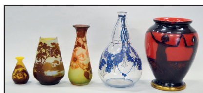
D'un ensemble de verreries par Emile GALLE, DELATTE et Marcel GOUPY