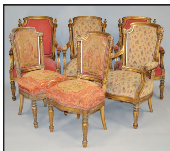
Salon en bois sculpté et doré comprenant quatre fauteuils et une paire de chaises. Style Louis XVI, ep. Napoléon III 450/500