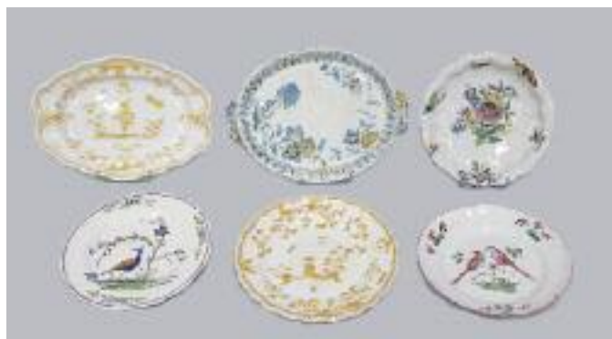
Collection de faïences régionales du XVIIIe siècle