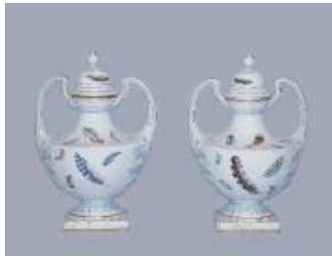
Emile GALLE (1846-1904) - Paire de vases couverts à anses en faïence à décor de plumes. Signés. (une prise restaurée) H. 18 cm 50/60