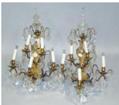
Grande paire d'appliques en bronze et pampilles à cinq lumières. Style Louis XV. H. 70 cm 350/400