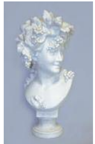
CARRIER-BELLEUSE (1824-1887) - "L'automne" Sculpture en biscuit, signée au dos. (petites égrenures) H. 48 cm