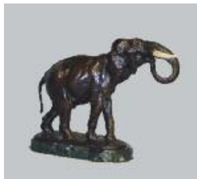
FIDI (XIXe - XXe siècle) "Eléphant marchant" Epreuve en bronze patiné et ivoire. Signée sur la base. H. 29 L. 29 P. 15 cm