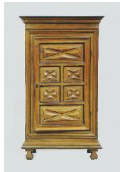
Petite armoire en noyer mouluré et bois noirci, ouvrant à un vantail à pointe de diamant. Repose sur des pieds droits. Début du XVIIIe siècle H. 199 L. 105 P. 56 cm 350/400