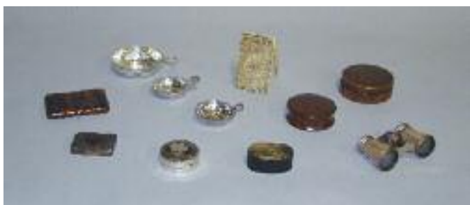
Collection d'objets de vitrine : Tastes vin en argent, boîtes diverses, cadran solaire-boussole en ivoire, paire de jumelles de théâtre.