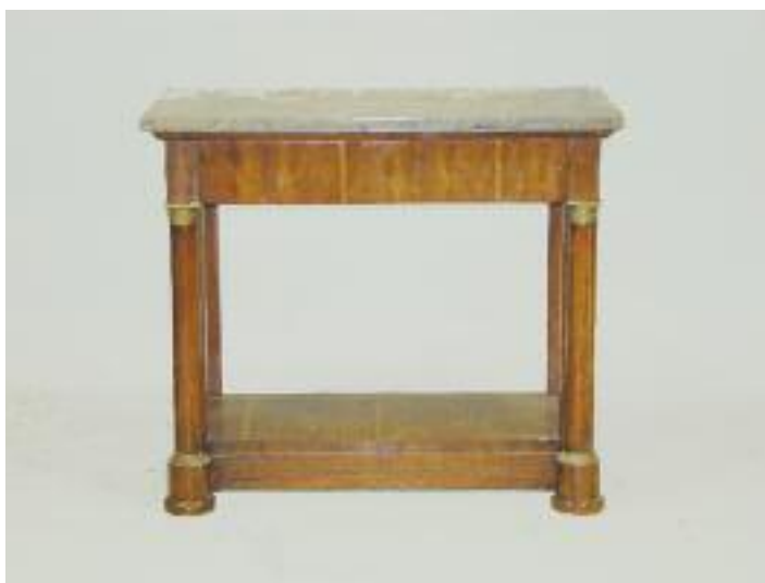
Console en bois de placage ouvrant à un tiroir en façade. Montant à colonnes détachées. Dessus de marbre. Fin époque Empire (sautes de placage) H. 85 L. 97,5 P. 47,5 cm 350/400