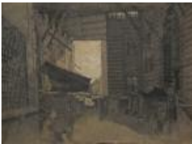
ECOLE ORIENTALISTE DU XIXe s "Vue d'un marché oriental" Dessin au crayon sur trois feuilles. (petits enfoncements) 43,5 x 58 cm