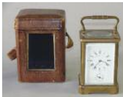
Pendule d'officier en bronze et verre. Cadran signé Charles Oudin, Palais Royal 52 Paris . Dans son écrin d'origine avec sa clé. XIXe siècle. H. 13,5 cm 700/800 Charles Oudin, Horloger de la marine de l'Etat et également Horloger du Tsar.