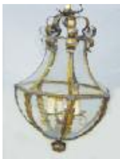
Lustre en fer forgé et verre bombé. Style Louis XVI 80/100