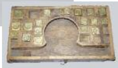
Boîte de pesage de la monnaie en bois contenant un trébuchet avec ses poids par André Lefranc (actif entre 1630 et 1664). XVIIe siècle (manque six poids) H. 4 L. 21 P. 11,5 cm 400/450