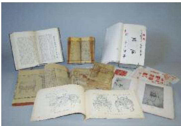
Ensemble d'ouvrages Chinois ou sur la Chine ("Le Lavis en Extrême-Orient, Chine" Edition Gores ; "Catalogue des jades", 1973 ; CHINE - Ensemble de 18 livrets imprimés sur les rites du mariage en chine ; Dictionnaire Kangxi ; Col- lection d'impressions de cachets Chinois imprimé sur papier)