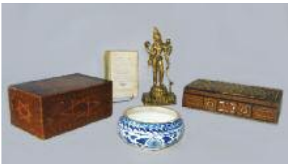
Coffret en bois et marqueterie à décor d'étoiles de David et de filets en bois clair et ébène. Orient.(petits manques) H.10,5 L. 24 P. 16 cm