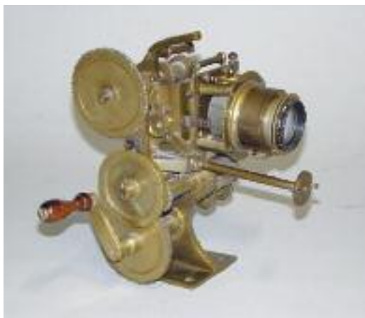
DARLOT Paris - Projecteur ancien pour film en laiton. Signé DARLOT PARIS. Fin XIXe siècle.