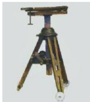
PIED D'APPAREIL PHOTOGRAPHIQUE à chambre noire en bois à plateau réglable. XIXe siècle. H. 103 cm 400/500