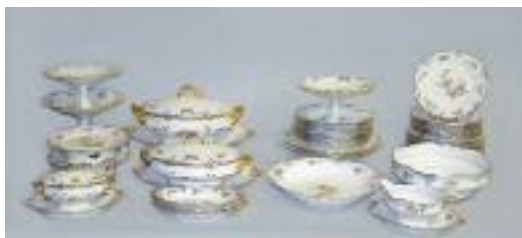
LIMOGES, PALLAS - Partie de service en porcelaine à décor de fleurs, peignées bleues et dorures comprenant : une soupière, une terrine couverte, deux saucières, trois compotiers, un saladier, deux présentoirs à gâteaux, deux ravier, quatre plats de service et des assiettes plates, creuses et à dessert.