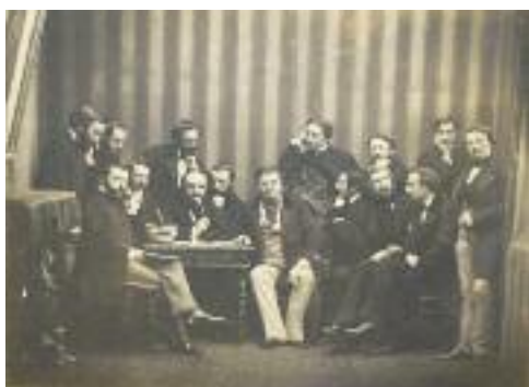
DISDERI - "Groupe d'écrivains et d'artistes dans un intérieur", Vers 1855-60

Photographie, tirage papier albuminé collé sur carton fort. Timbre sec "Disderi et Cie photographes de l'empereur" et inscription à l'encre "Donné à mon ami Reiset 20 décembre 1859. Billing". (mouillure sur le bord du carton)