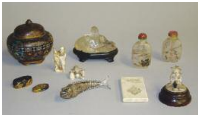
JAPON - Vase couvert en bronze à décor d'émaux cloisonnés. Couvercle à prise en forme de fleurs. XIXe siècle.