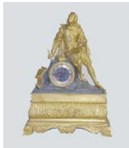
Pendule en bronze ciselé et doré à décor d'un poète assis sur un rocher en bronze patiné d'où s'échappe le mouvement. Elle repose sur une large base à décor de feuilles d'acanthes et entrelacs. Epoque Restauration. H. 49 cm 800/1 000