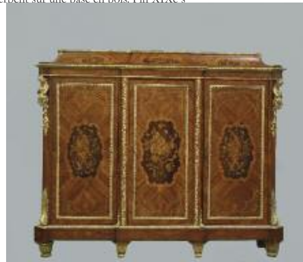
Pendule en bronze ciselé et doré à décor de consoles d'où s'échappent deux têtes de femmes. Le mouvement posé sur une colonne cannelée est surmonté d'un vase couvert. Elle repose sur six pieds. Cadran à chif- fres émaillés, signé Jean à Rennes. Fin XIXe siècle.