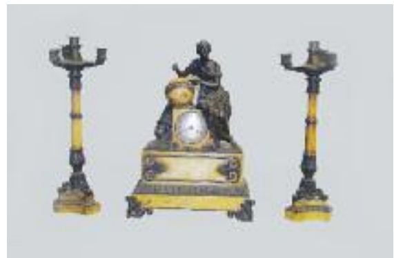
Garniture de cheminée comprenant une paire de candélabres à quatre lumières et une pendule en bronze patiné et marbre rance à décor d'une jeune femme symbolisant l'Astronomie, une tête de sphinx à ses pieds. Mouvement signé "LE GUE rue St Honoré n°135". XIXe siècle.