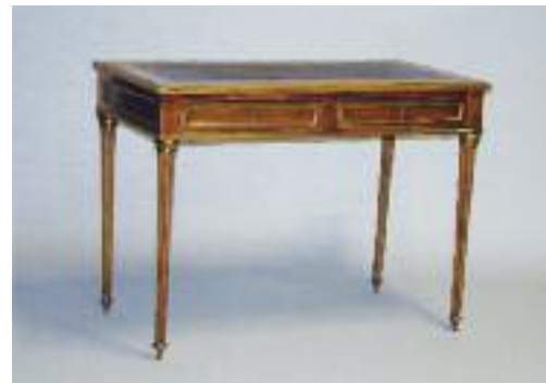
Petit bureau rectangulaire en acajou et placage d'acajou ouvrant à deux tiroirs en ceinture. Il repose sur quatre pieds fuselés cannelés. Ornementations de filets de bronze doré. Epoque Louis XVI (petits manques et restaurations).