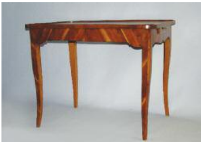
Table à écrire rectangulaire en bois de placage ouvrant à un tiroir en ceinture. Repose sur des pieds cambrés. Epoque Louis XV (petites sautes de placage) H. 70 L. 85 P. 61 cm 400/500