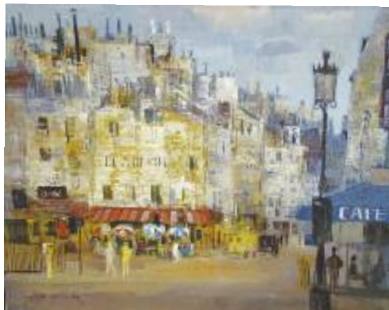
Makoto MASUDA (né en 1905), Ecole de Montmartre "Rue animée à Paris" Huile sur toile, signée en bas à gauche. 60 x 73,5 cm 200/220