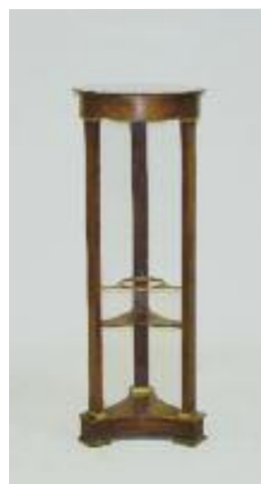
Barbière en acajou. Piétement tripode droit terminé par une base pleine. XIXe siècle H. 90 D. 33,5 cm 150/200