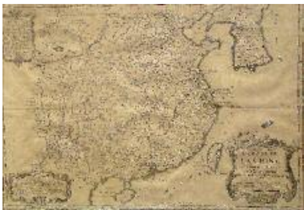
N. BELLIN - Carte représentant "l'Empire de la Chine" par N. BELLIN, ingénieur de la Marine, datée 1748. 29 x 41 cm 200/300