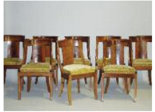
Suite de huit chaises à dossier gondole en noyer et placage de noyer. Reposent sur des pieds sabres, assise de velours vert à décor de rosace. Epoque Restauration. H. 84 cm