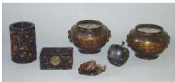
CHINE - Porte-pinceau cylindrique en écaille à décor ajouré de rinçaux et papillons dans des cartouches . Epoque Daoguang. H. 14 cm 500/600