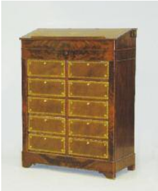
Meuble écritoire formant cartonier en acajou et placage d'acajou. Il ouvre à un abattant gainé de cuir fauve doré aux petits fers découvrant un casier. Une tirette sur le côté formant porte plume et encrier. Un tiroir en façade et dix casiers sur deux rangs à façade en cuir fauve. XIXe siècle.