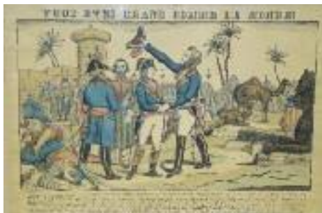
"Vous êtes grand comme le monde" et "Débarquement de Napoléon" Deux gravures en couleurs (usures) XIXe siècle 41 x 60 et 39 x 56 cm