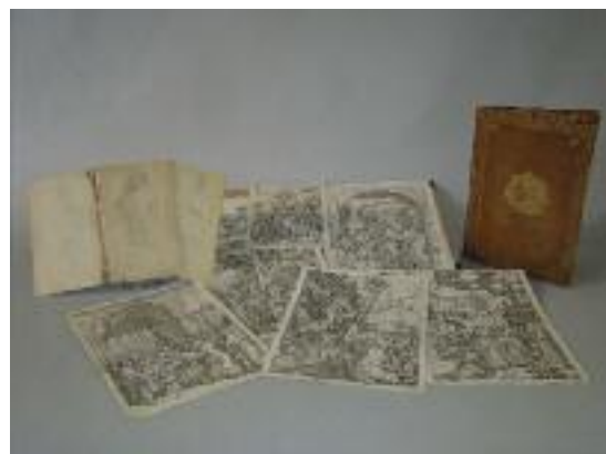
Ensemble de gravures d'après Albrecht DURER. Fin XVIIIe siècle 800/1 000