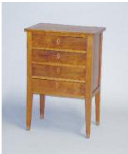
Petit chiffonnier en noyer ouvrant à quatre tiroirs. Repose sur des pieds gainés. Epoque Restauration. H. 74,5 L. 50 P. 31 cm 150/180