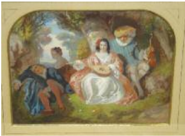
BARON (actif au XIXe siècle) "Scène galante" et "Jeunes femmes au bord de l'eau" Paire de pastels, signés en bas Baron 1842. 25 x 32,5 cm