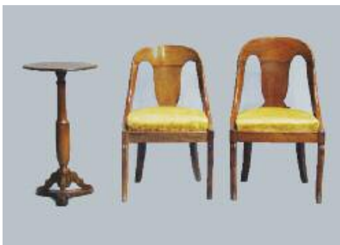
Guéridon en noyer, plateau circulaire marqueté d'une étoile. Piétement balustre. XIXe siècle. (petits manques) H. 70 D. 38 cm 50/60