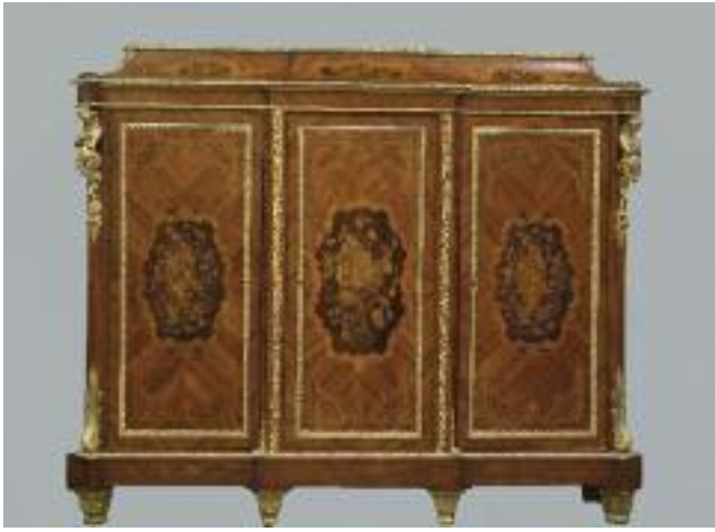
Meuble à hauteur d'appui en bois de placage, marqueterie et bronze doré. Il ouvre à trois portes à décor de bouquets de fleurs et insectes dans des cartouches contournées. Montants à pans coupés ornés d'appliques en bronze ciselé et doré à décor de bustes de femmes. Repose sur quatre pieds en bronze ciselé et doré à décor de feuillages à l'avant et des pieds droits à l'arrière. Style Louis XVI, Fin XIXe siècle. H. 148 L. 181 P. 44 cm