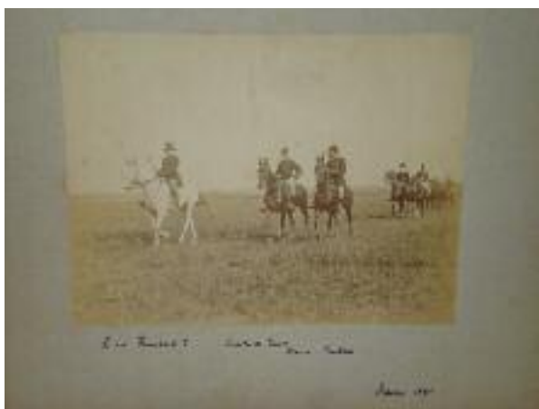
"Le Roi Humbert 1er d'Italie, le Comte de Turin, le Baron Cantoni" Octobre 1890 Photographie, tirage papier albuminé collé sur carton. Annoté en bas et daté 1890.