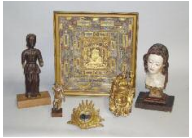
Vierge en bois sculpté et patiné. XVIIIe siècle. (manques, tête recollée). H. 46 cm 300/400