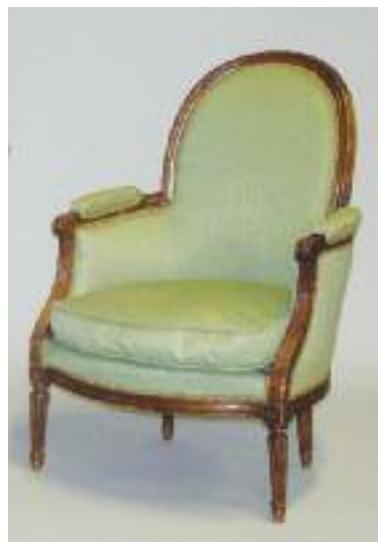
Bergère en noyer mouluré et sculpté. Repose sur quatre pieds fuselés, cannelés et rudentés. Fin d'époque Louis XVI. (manques et renforts) H. 95 L. 70 P. 58 cm 180/200