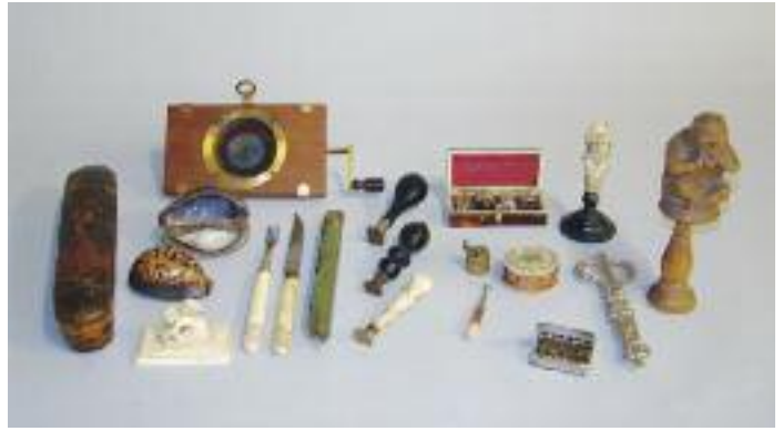
IRAN, époque QADJAR - Plumier en carton bouilli à décor polychrome d'un couple et de personnages. XIXe siècle. (quelques manques) L. 22,5 cm 80/100