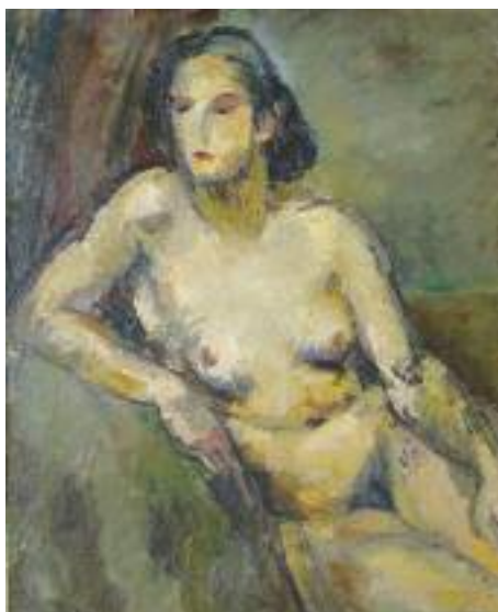
ARMEILLE (née en 1900) "Femme nue assise" Huile sur toile, signée en bas à gauche et datée au dos 1933. 55 x 46 cm 250/300