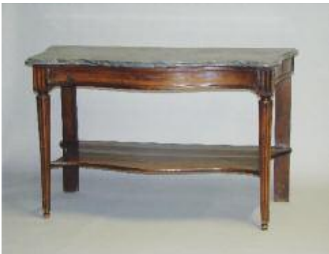
Console en bois naturel mouluré à façade mouvementée. Elle repose sur deux pieds droits à l'arrière et deux pieds fuselés cannelés à l'avant réunis par une tablette d'entrejambe. Dessus de marbre gris veiné à bec de corbin. Fin de l'époque Louis XVI (restaurations) H. 82 L. 134 P. 66 cm