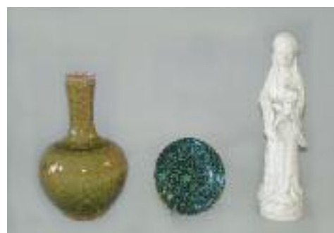
CHINE - Vase à haut col en porcelaine "peach blum vert". Porte une marque apocryphe Qianlong. Epoque République. H. 30 cm 1 400/ 1 500