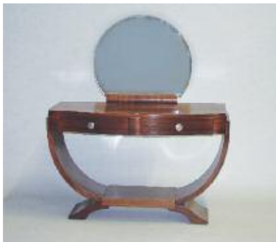
Coiffeuse en bois de placage surmonté d'un miroir rond ou- vrant à deux tiroirs et reposant sur un piétement lyre. Vers 1930-40 H. 125 L. 114 P. 50 cm 1 000/1 200