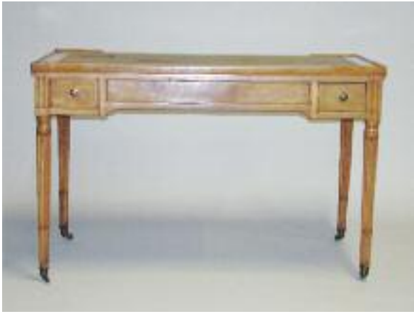
Bureau formant table à jeu en noyer mouluré ouvrant à quatre tiroirs dont deux simulés. Plateau recouvert de maroquin doré au petit fer sur une face et de feutre sur l'autre. Il découvre un jeu de Jacquet en placage d'ébène et ivoire avec ses jetons. Il repose sur des pieds fuselés, cannelés et rudentés terminés par des roulettes. Epoque Louis XVI. (déchirures au maroquin et petites fentes au plateau) H. 71,5 L. 112 P. 58 cm 400/500