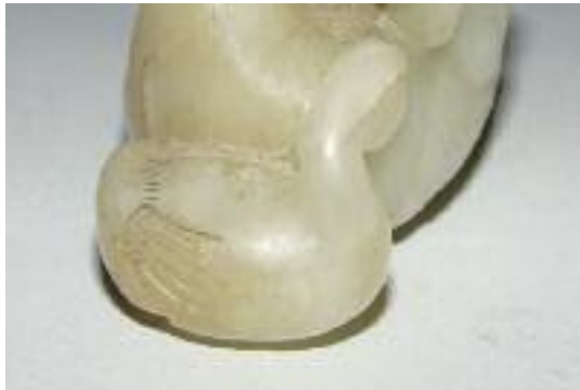
MITORAJ - Ed Artcurial- Paire de bougeoirs en bronze patiné. Signée et numérotée sous la base 53/150.