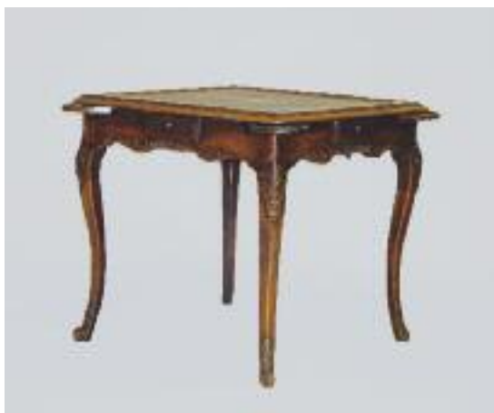
Table à jeu en noyer mouluré et sculpté à décor d'acanthes et cartouches. Elle ouvre à quatre tiroirs et quatre tirettes. Repose sur quatre pieds cambrés terminés par des feuillages et enroulements. (reprises, restaurations et manque à un bout de pied) Travail de la Vallée du Rhône de la fin du XVIIIe siècle. H. 72 L. 78 P. 78 cm 400/500