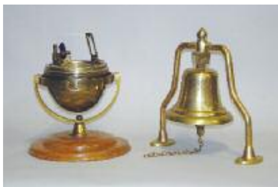
Boussole de bateau en laiton et verre reposant sur un socle en bois et une cloche en bronze. H. 32 et 38 cm 180/200