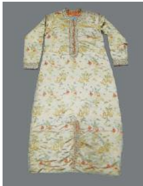
Longue robe en soie à décor brodé de dragons à cinq griffes et phénix. Extrême-Orient ou Orient. H. 139 cm 500/600