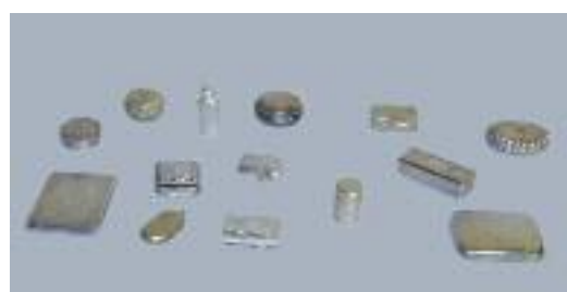
Collection de boîtes à pilules, flacon, étuis en argent