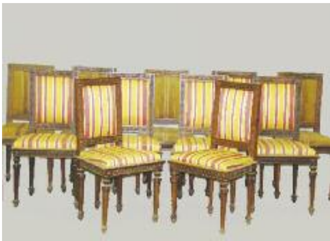
Suite de treize chaises en bois mouluré et sculpté à décor de feuillages entrelacés, pastilles. Reposent sur des pieds fuselés et cannelés. Style Louis XVI, XIXe siècle. (manque un pied à une chaise, petits accidents et manques) H. 90 L. 46 P. 41 cm