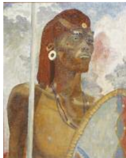
ECOLE AFRICANISTE, ROUX (XIXe-XXe s.), "Guerrier Massai", vers 1930 Huile sur carton. Porte une signature Roux en bas à droite. 61 x 50 cm