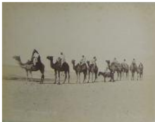
EGYPTE, "Caravane dans le desert", vers 1870-80 Photographie, tirage papier albuminé collé sur carton. 22 x 30 cm