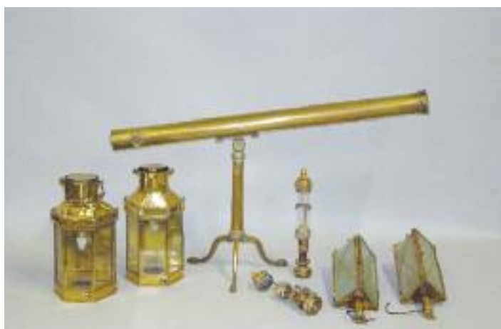
Paire de lanternes anglaise de voiture à cheval en laiton. XIXe siècle. H. 41 cm 200/300