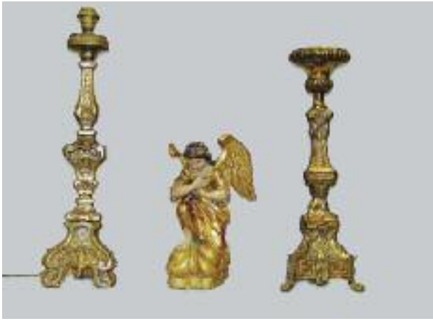
Pique-cierge en laiton repoussé à décor à la grecque de pampres de vigne et feuilles d'acanthés. Style Louis XVI. XIXe siècle. (petits accidents) H. 59,5 cm 60/80