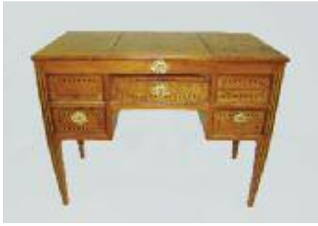
Coiffeuse en bois de placage à plateau marqueté de rinceaux. Tiroirs ornés de filets d'ébène et bois clair. Repose sur des pieds gaines à mar- queterie simulant des cannelures. Époque Louis XVI