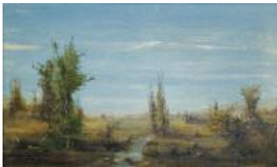
BERNALET? "Paysage, rivière, château et ruines" Huile sur toile, signée en bas à gauche. 33 x 55 cm 150/200