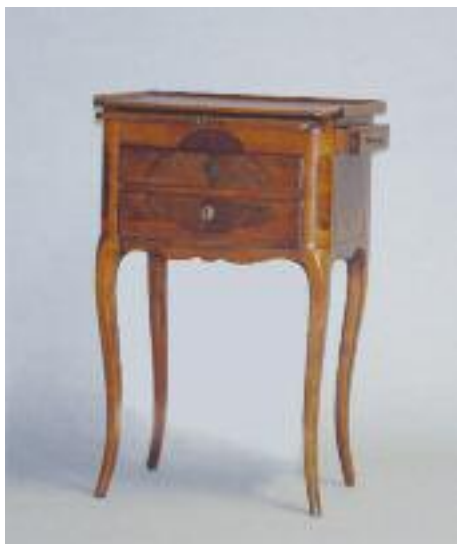
Table de salon en bois naturel et placage ouvrant à une tirette, un tiroir latéral et deux tiroirs en façade. Elle repose sur quatre pieds légèrement cambrés. Travail du Dauphiné d'époque Louis XV. H. 72 L. 46 P. 31 cm 300/400