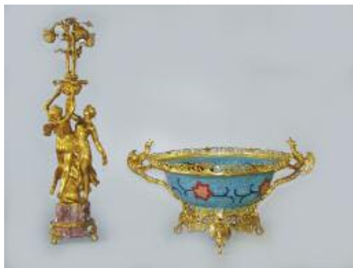
BARBEDIENNE - Lampe en bronze doré à décor de deux nymphes tenant trois bras de lumière. Repose sur une base cannelée en marbre. XIXe siècle. H. 68 cm 600/800