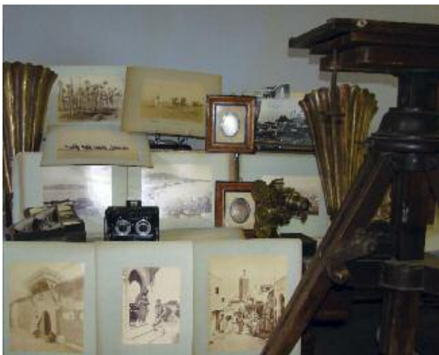
COLLECTION DE PHOTOGRAPHIES ANCIENNES : Daguerrotypes, (Orientalistes : Tanger, Tlemcen, Brousse, Palestine, Egypte ; France, Europe) ; Chambre noire, Pieds de chambre noire, caméras, projecteur XIXe s DARLOT de cinéma, Appliques en bois et laiton des Folies Bergères.