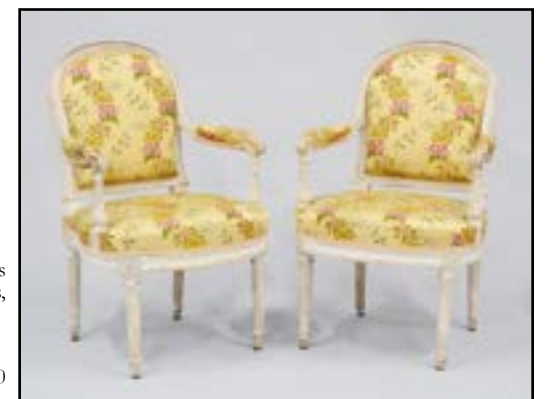
PAIRE DE FAUTEUILS à dossier droit en bois mouluré rechapé crème. Pieds fuselés, cannelés et rudentés. Estampillée Georges JACOB Epoque Louis XVI H. 92 L. 59 P. 52 cm