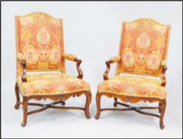
PAIRE DE FAUTEUILS en noyer mouluré et sculpté. Pieds cambrés réunis par une entretoise en X. Début d'époque Louis XV H. 108 L. 70 P. 65 cm