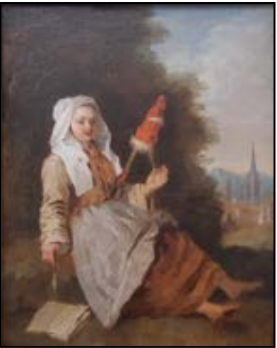
Ecole FRANCAISE DU XVIIIe siècle « La Fileuse » Huile sur toile. 40 x 32 cm