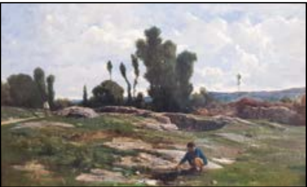
ADOLPHE APPIAN (1818-1898) « Personnage accroupi dans un paysage » Huile sur toile, signée en bas à gauche et daté 1861. (réentoilé) 41 x 66 cm