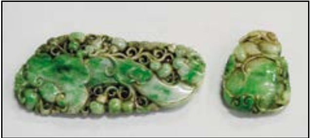
CHINE - Sculpture en jade verte à décor de ruyi dans des rinceaux. 13,5 x 7 cm