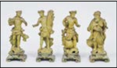
QUATRE SCULPTURES en peuplier peint façon bronze représentant les quatre saisons. 1ère moitié du XVIIIe siècle. H. 26 cm