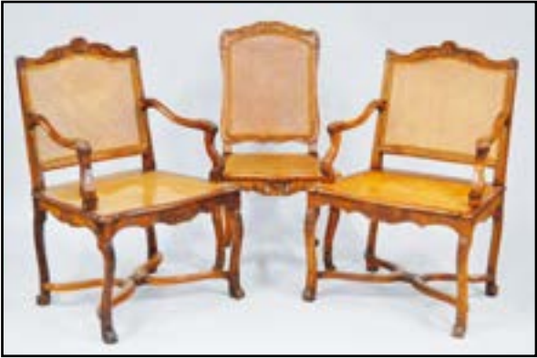
PAIRE DE FAUTEUILS cannés à dossier à la reine en noyer mouluré et sculpté de coquilles et quadrillages. Pieds cambrés réunis par une entretoise en X. Travail Lyonnais d'époque Louis XV (restaurations) H. 93 L. 64 P. 55 cm