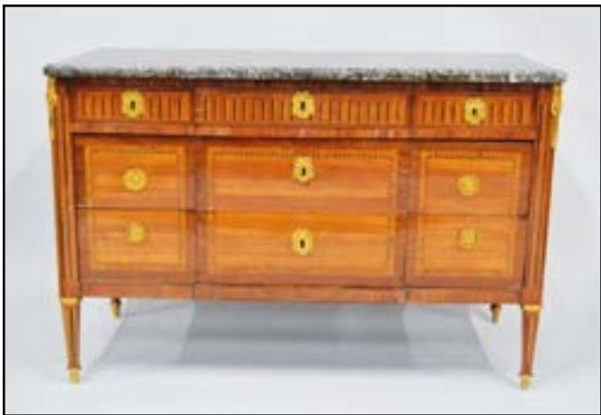
COMMODE en bois de placage et marqueterie de filets et cannelures simulées. Elle ouvre à cinq tiroirs sur trois rangs. Elle repose sur de petits pieds à cannelures simulées. Dessus de marbre gris de Sainte-Anne (restauré). Estampillée F.C. FRANC Epoque Louis XVI (restaurations, bronzes rapportés) H. 83 L. 126 P. 58 cm