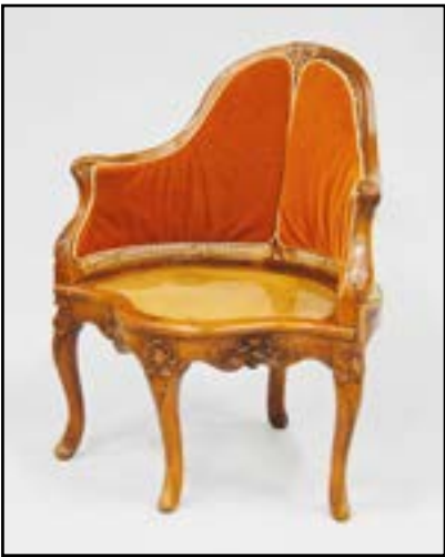
LARGE FAUTEUIL DE BUREAU canné en bois mouluré et sculpté d'agrafes, rocailles et feuillage. Il repose sur quatre pieds cambrés. Epoque Louis XV, attribué à Etienne MEUNIER H. 91 L. 73 P. 55 cm