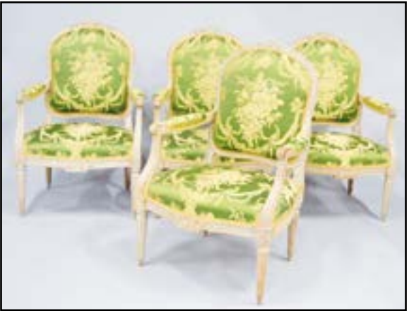
QUATRE FAUTEUILS en bois mouluré, sculpté et rechapé crème à décor de feuillages et rubans. Ils reposent sur des pieds fuselés et cannelés. Estampillés PLUVINET Epoque Louis XVI H. 98 L. 63 P. 57 cm 8 000/10 000 Philippe Joseph PLUVINET, Reçu maître en 1754