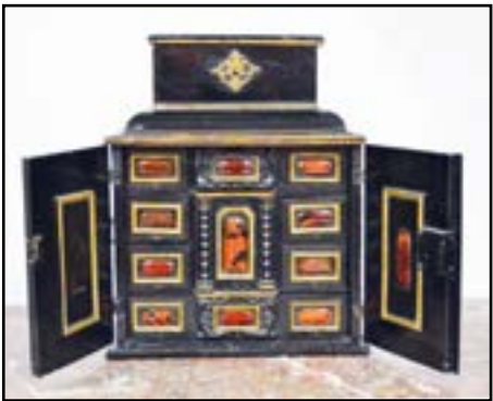
PETIT CABINET portatif en bois noirci et écaille de tortue ouvrant à deux vantaux découvrant 10 tiroirs et une petite porte entourée de colonnes torsadées. Anvers, XVIIIe siècle (petites restaurations) H. 43 L. 35 P. 19 cm