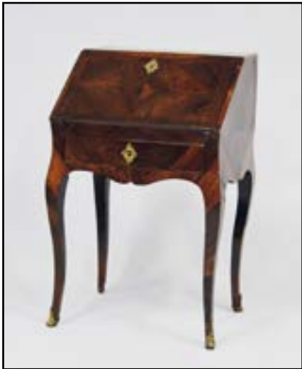
PETIT BUREAU dos d'âne en placage de bois de violette ouvrant à un abattant et un tiroir. Epoque Louis XV H. 83 L. 52 P. 40 cm