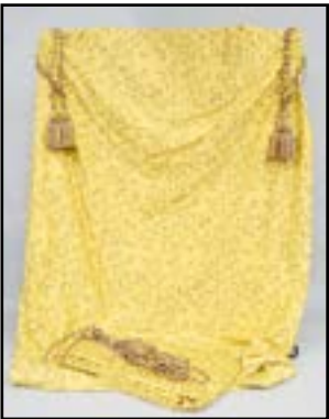
UNE PAIRE DE RIDEAUX en soie lyonnaise jaune brodée d'oiseaux branchés. Probablement de la Maison Tassinari à Panissières. Doublure jaune. Avec embrasses et tringle. 340 x 190 cm