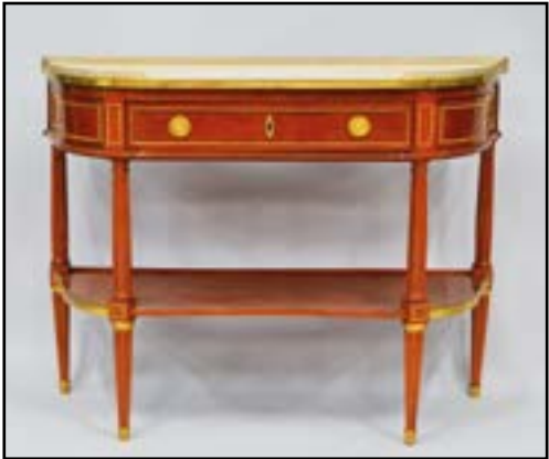
CONSOLE demi-lune en acajou et placage d'acajou et ornementation de bronzes. Elle ouvre à trois tiroirs et repose sur quatre pieds fuselés réunis par une tablette d'entretoise. Dessus de marbre blanc cerné d'une galerie. Estampillée Fidelis SCHEY Epoque Louis XVI H. 88 L. 113 P. 42 cm