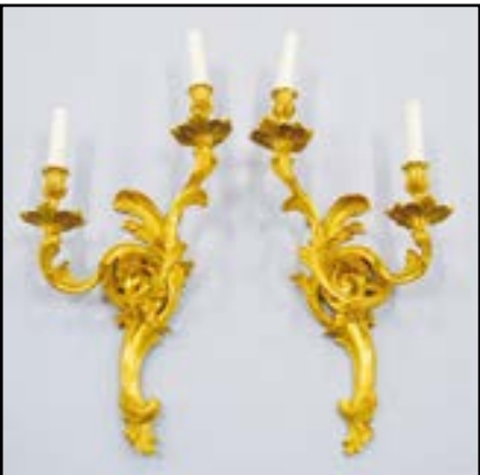
PAIRE D'APPLIQUES à deux lumières en bronze ciselé et doré à décor rocaille. Style Louis XV H. 56 cm