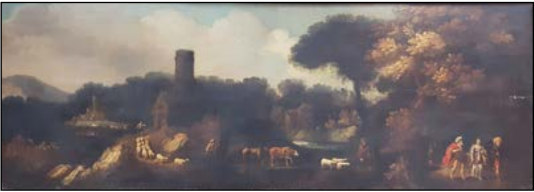
Ecole HOLLANDAISE du XVIIIe siècle, attribué à Van ARTOIS « Scène biblique, personnages et bergers dans un paysage » Huile sur panneau. (fente) 53 x 147 cm