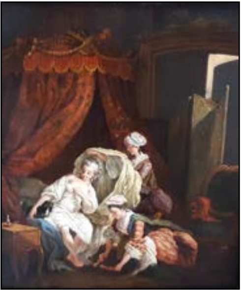
Ecole de François BOUCHER , XVIIIe siècle « Le lever » Huile sur panneau. 31 x 28 cm