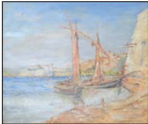
ECOLE PROVENÇALE XXe siècle « Bateau et port » Huile sur toile marouflée sur panneau. 50 x 58 cm