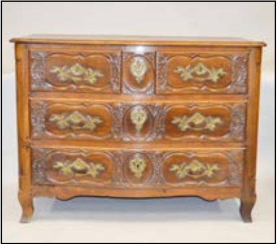
COMMODOE à façade galbée en bois mouluré et sculpté d'agrafes et feuillage. Elle ouvre à quatre tiroirs sur trois rangées. Repose sur des pieds cambrés. Epoque Louis XV H. 97 L. 134 P. 65 cm