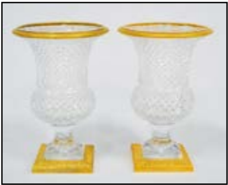
PAIRE DE VASES en cristal taillé en pointe de diamant et cerclé de bronze doré. H. 23 cm