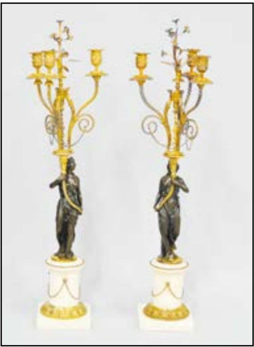
PAIRE DE CANDÉLABRES en bronze ciselé, patiné et doré à décor d'une jeune femme tenant une corne d'abondance d'où s'échappent trois lumières. Repose sur une base cylindrique en marbre blanc. Epoque Louis XVI H. 85 cm 2 000/2 500