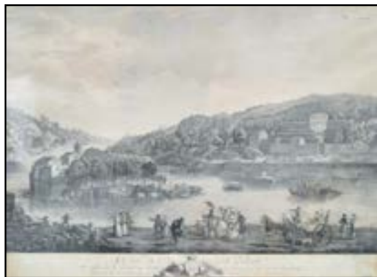
« VUE DE L'ILE BARBE » Gravure encadrée. XVIIIe siècle