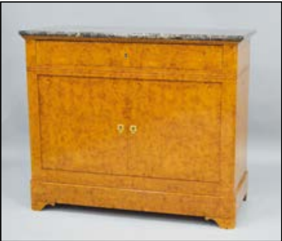
COMMODE à portes ouvrant à un tiroir et deux vantaux en placage de bois de loupe. Dessus de marbre gris veiné. Epoque Charles X H. 103 L. 123 P. 54 cm