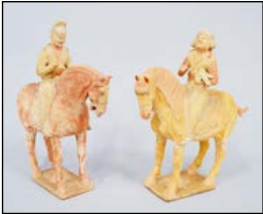
CHINE - Dignitaire à cheval. Terre cuite à engobe et traces de polychromie. Dynastie Tang (618 à 907) H. 39 cm