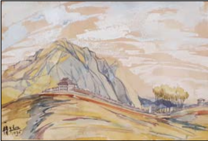
Y. EOU (Actif début XXe siècle) « Paysage chinois, Tibet » Aquarelle, signée en bas à gauche et datée 1936 35 x 32 cm