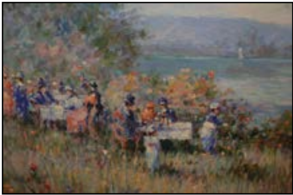
S. MARISI (XXe siècle) « Le déjeuner champêtre » Huile sur panneau, signée en bas à droite. 50 x 58 cm