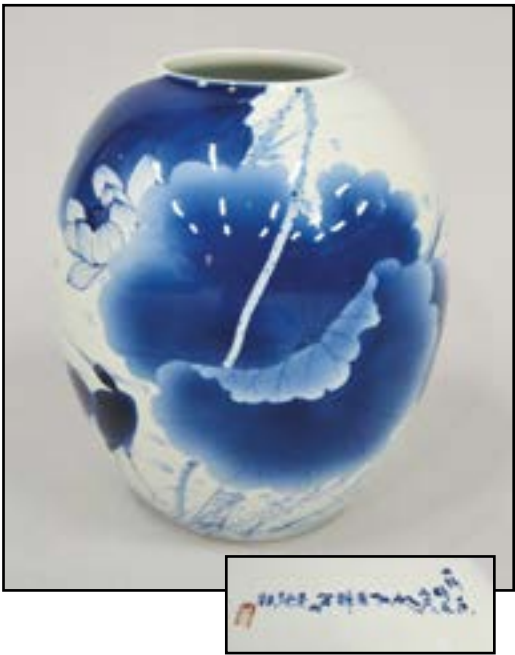
CHINE - Grand vase en porcelaine blanc bleu à décor de lotus et oiseaux. Porte des inscriptions. Travail contemporain. H. 38 cm