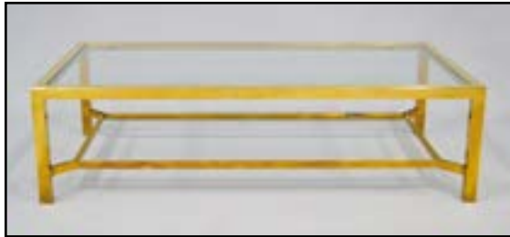
TABLE de salon en métal doré à deux plateaux en verre. H. 41 L. 150 P. 80 cm