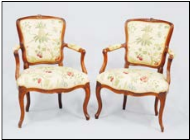
PAIRE DE FAUTEUILS cabriolet en noyer. Pieds cambrés. (recouverts de tissu brodé à décor de fleurs et fruits). Travail Provincial, d'époque Louis XV H. 86 L. 62 P. 52 cm 300/400