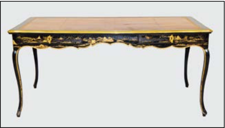
BUREAU en bois mouluré noirci et décor doré de paysages en vernis martin. Il ouvre à deux tiroirs en façade et deux tiroirs simulés de l'autre côté. Il repose sur des pieds légèrement cambrés. Plateau recouvert de cuir fauve doré aux petits fers. Ancien travail en partie d'époque Louis XV (décor postérieur, reprises au décor) H. 73 L. 165 P. 87 cm