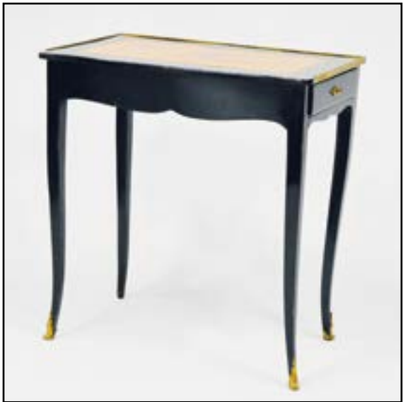
PETITE TABLE écritoire rectangulaire en bois noirci ouvrant à un tiroir avec encriers. Plateau recouvert de cuir fauve cerné d'une lingotière. Pieds cambrés. Epoque Louis XV H. 72 L. 69 P. 43 cm