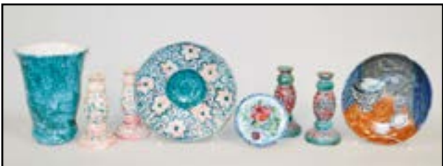
COLLECTION DE CÉRAMIQUES DE VALLAURIS vers 1950