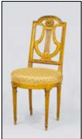
PETITE CHAISE à dossier lyre en bois doré. Repose sur quatre pieds fuselés cannelés. Epoque Louis XVI H. 92 L. 45 P. 48 cm