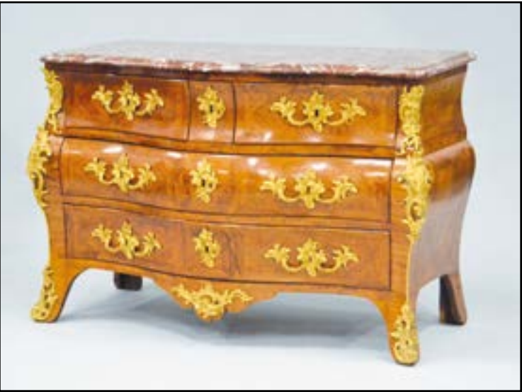
COMMODE galbée en bois de placage ouvrant à quatre tiroirs sur trois rangs séparés par des traverses. Elle repose sur de petits pieds cambrés. Riche ornementation de bronzes ciselés et dorés à décor de masques, cartouches et agrafes. Dessus de marbre brèche rouge veiné. Estampillée deux fois I DUBOIS Epoque Régence (quelques restaurations) H. 88 L. 127 P. 65 cm 6 000/8 000 Jacques DUBOIS, Reçu maître en 1742, Ebéniste de la Couronne. Pour une commode similaire voir vente Tajan 14 octobre 2005 lot 150