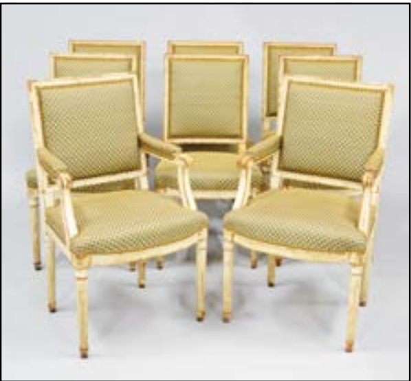
SIX CHAISES ET DEUX FAUTEUILS en bois mouluré rechampi crème. Dossiers cannés. Reposent sur des pieds fuselés et cannelés. Epoque Louis XVI Fauteuils : H. 92 L. 54 P. 48 cm Chaises : H. 92 L. 49 P. 43 cm