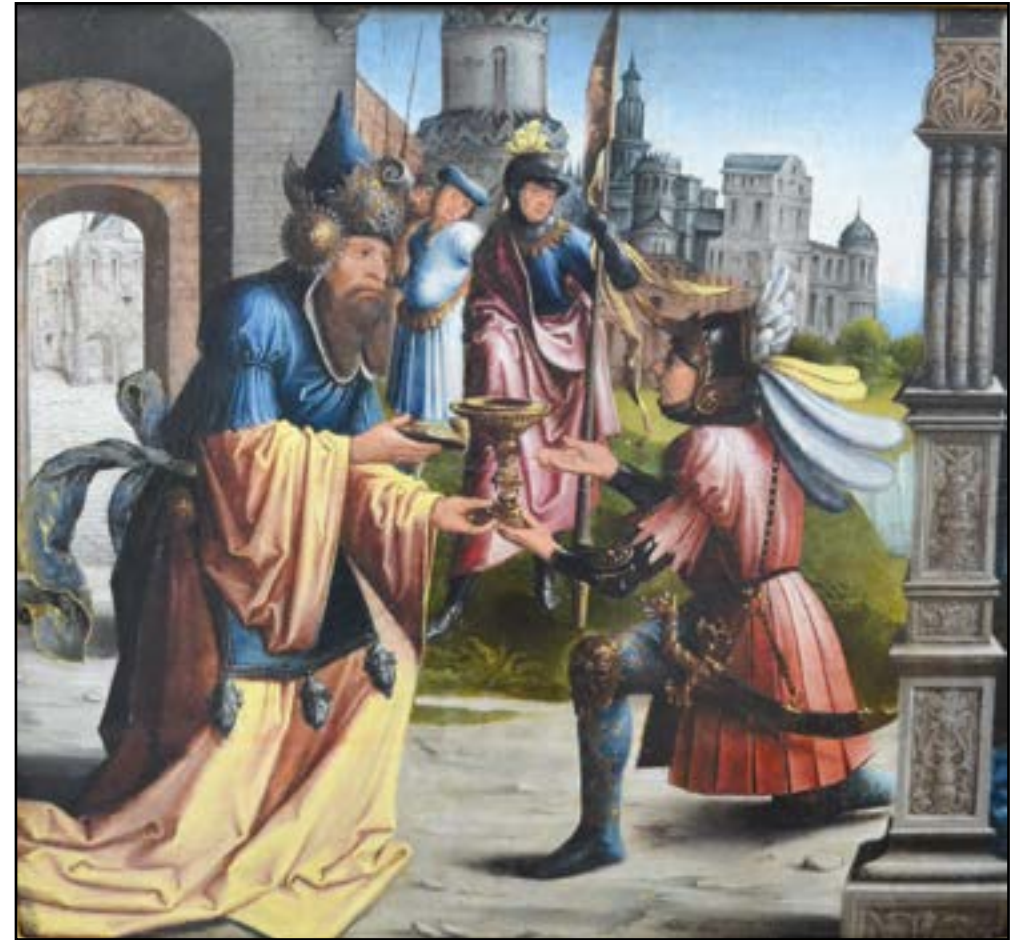
Jan II VAN CONINXLOO (c.1489-c.1546) « La rencontre d'Abraham et de Melchisédech » Huile sur panneau de bois. 54,5 x 50 cm