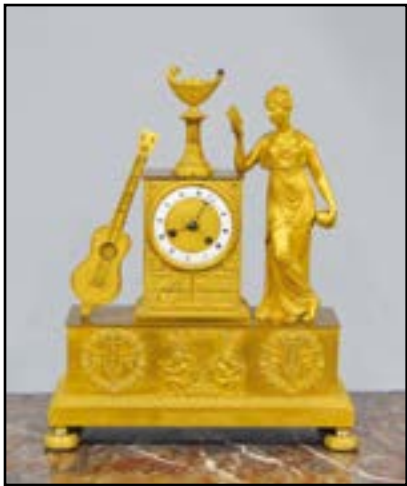
PENDULE en bronze doré à décor d'une jeune femme au livre et guitare. XIXe siècle. H. 43 cm