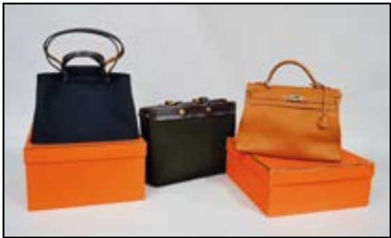
HERMES - Sac « Cabag » en toile noire et prises en cuir marron, porté main ou épaule. Avec sa boîte et dust bag. 26 x 37 cm 600/700