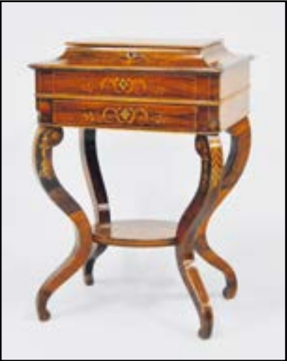
PETITE COIFFEUSE rectangulaire en bois de placage de palissandre et marqueterie de bois clair. Piétement sinueux réunis par une tablette d'entrejambe. Epoque Charles X (restaurations) H. 74 cm