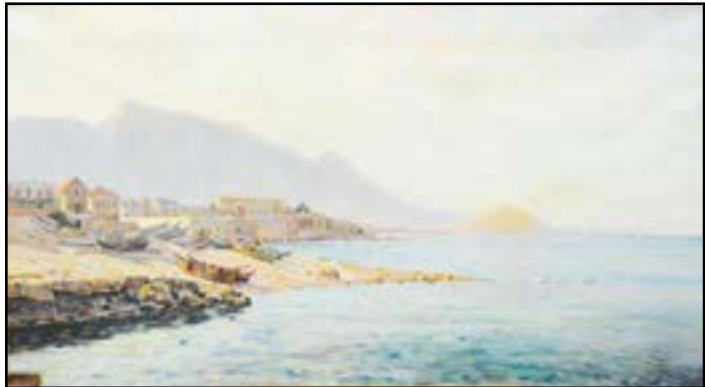
Paul Alphonse MARSAC (1865- ?) « Matinée irisée sur la côte d'azur » Huile sur toile, signée en bas à droite et datée 1904. 71 x 130 cm