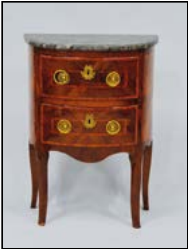
DEUX PETITES COMMODOES demi-lune en bois de placage ouvrant à deux tiroirs. L'une à décor d'un cercle sur les côtés et l'autre de deux cercles sur les côtés. Dessus de marbre gris veiné. (un marbre restauré) Travail Italien du XVIIIe siècle. H. 83 L. 61 P. 37 cm H. 83 L. 61 P. 32,5 cm