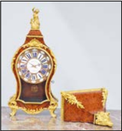
CARTEL ET CONSOLE D'APPLIQUE en marqueterie de bois de rose en frisée et bronzes ciselés et dorés. Le cadran est signé ADMYRAULT à Paris. Amortissement à décor d'un angelot tenant des éclairs. Epoque Louis XV H. 105 cm