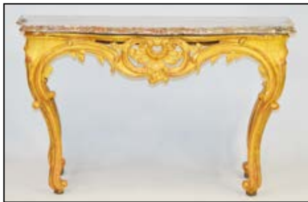
CONSOLE en bois sculpté ajouré et doré. Repose sur quatre pieds cambrés. Dessus de marbre rouge veiné. Epoque Louis XV (restaurations et renforts) H. 82 L. 79 P. 48 cm