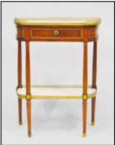
CONSOLE demi-lune en bois de placage ouvrant à un tiroir. Elle repose sur des pieds fuselés et cannelés réunis par une tablette d'entrejambe. Deux plateaux en marbre blanc veiné cerné d'une galerie. Epoque Louis XVI H. 87 L. 66 P. 30 cm