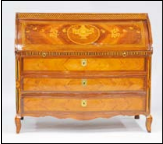
COMMODE formant bureau à cylindre à façade galbée en bois de placage et marqueterie à décor d'un vase couvert dans un médaillon, roses et cubes. Il ouvre à un cylindre et trois tiroirs. Montants droits et petits pieds cambrés. Montbéliard, époque Transition Louis XV-Louis XVI H. 110 L. 125 P. 60 cm 2 000/3 000