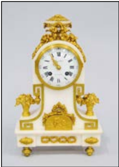
PETITE PENDULE borne en marbre blanc et bronzes ciselés et dorés. Cadran signé Planchon à Paris. Style Louis XVI H. 34 cm 700/800