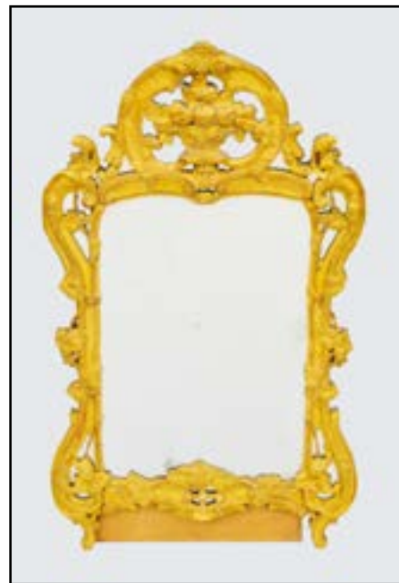
GLACE à parencloses en bois sculpté et doré à décor de feuillages et fruits. (doublee) Epoque Louis XV 120 x 72 cm