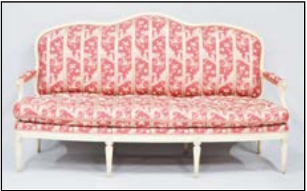
GRAND CANAPÉ à dossier plat en bois mouluré rechapé crème. Il repose sur huit pieds fuselés et cannelés. Estampillé S. BRIZARD Epoque Louis XVI H. 110 L. 190 P. 69 cm 1 800/2 000 Sulpice BRIZARD, reçu Maître en 1762