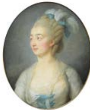
Ecole FRANCAISE du XVIIIe siècle « Portrait de jeune femme au ruban bleu et plumes » Huile sur toile ovale. 60 x 40 cm