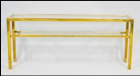
CONSOLE en métal doré à deux plateaux en verre. H. 75 L. 175 P. 36 cm