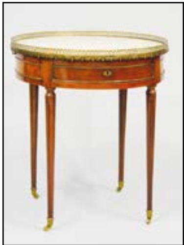
TABLE BOUILLOTTE ronde en bois de placage. Elle ouvre à deux tiroirs, des tirettes et repose sur quatre pieds fuselés et cannelés. Plateau en marbre blanc veiné cerné d'une galerie de laiton. Estampillée E. AVRIL deux fois sous les tiroirs. Epoque Louis XVI H. 72 Diam. 63 cm