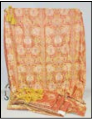
DEUX PAIRES DE RIDEAUX en tissu à décor de feuillage à fond rouge. Doublure bleue. Avec embrasses et tringle. 340 x 177 cm