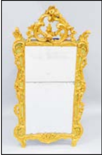
GLACE en bois sculpté doré et rechampi vert. Décor de fleurs et agrafes. Epoque Louis XV 187 x 90 cm