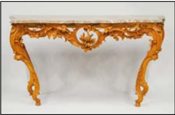
CONSOLE PROVENCALE en bois sculpté et ajouré à décor d'agrafes et acanthes. Pieds cambrés. Dessus de marbre rose veiné. Epoque Louis XV H. 87 L. 165 P. 72 cm