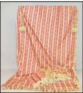
DEUX PAIRES DE RIDEAUX en satin rose et alternances de bandes vertes et crème. Probablement de la Maison Tassinari à Panissières. Bordure à pompons et franges. Doublure. Avec embrasses et tringle. 340 x 180 cm