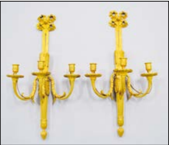
PAIRE D'APPLIQUES au carquois à trois bras de lumières en bronze ciselé et doré. Style Louis XVI H. 64 cm