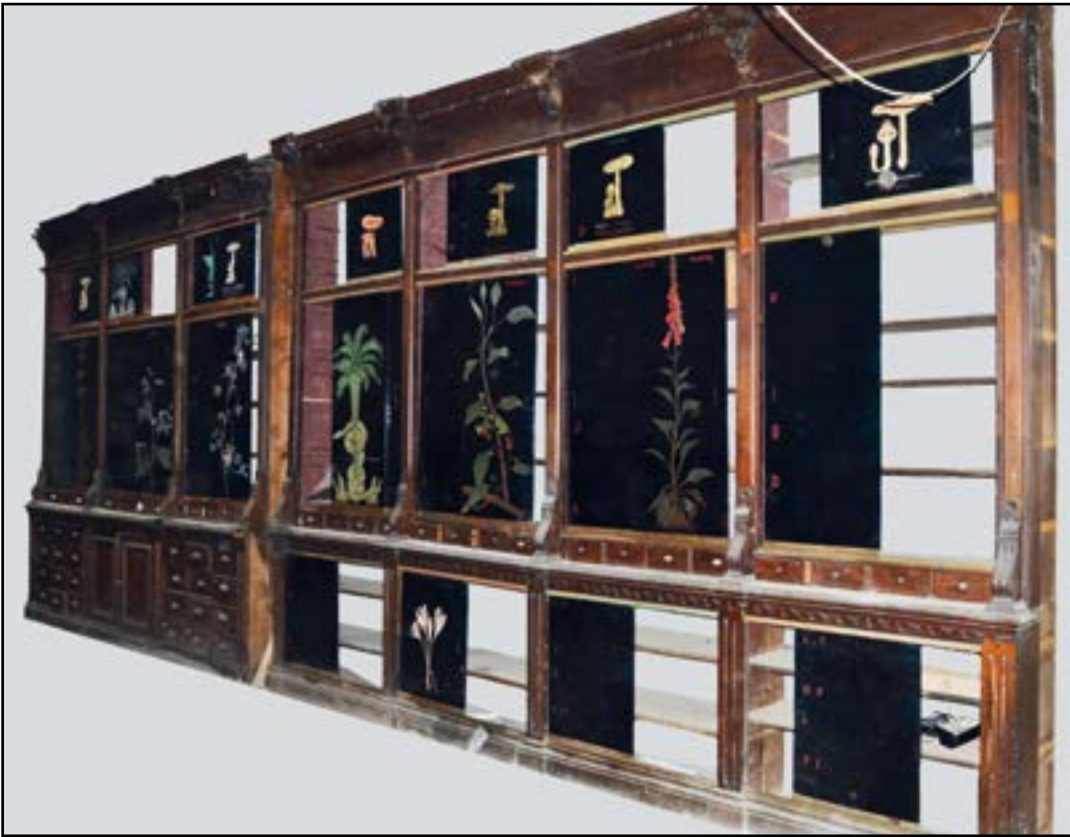
BOISERIE DE PHARMACIE comprenant deux meubles à deux corps en bois mouluré. Elle ouvre à des doubles portes coulissantes en verre (maronite) teinté vert émeraude à décor peint de champignons, palmiers et de plantes médicinales. Le premier meuble ouvre en partie supérieure à douze petits tiroirs surmontés de deux rangées de trois doubles portes coulissantes en verre teinté. (une petite porte manquante) et en partie inférieure à deux vantaux entourés de douze tiroirs de chaque côté. H.322 L. 330 P. 55 cm Le second meuble ouvre en partie supérieure à deux rangées de quatre doubles portes coulissantes en verre teinté (maronites) (manque 2) et en partie inférieure à quatre doubles portes coulissantes en verre teinté (maronites) (manque 3) H.322 L. 395 P. 43 cm (Manques, usures à la polychromie, oxydations aux rainures coulissantes, manque 1 petite porte et 5 grandes) Vers 1947-48 4 000/5 000 Provenance : Pharmacie de Rive de Gier (Loire) Visible sur place sur rendez-vous.