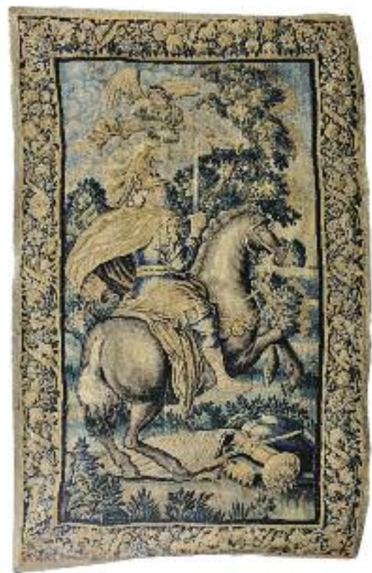
AUBUSSON , XVII e siècle - Tapisserie en laine à décor de Saint Cavalier et Ange. (recoupée et restaurations) 290 x 184 cm 1 000/1 200