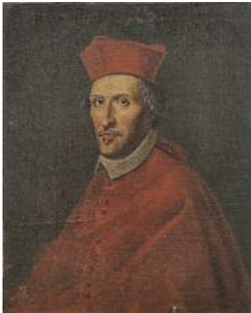
ECOLE FRANCAISE DU XVIII e siècle « Portrait du cardinal de Crivelli » Huile sur toile, rentoilée. 71 x 57 cm 500/600