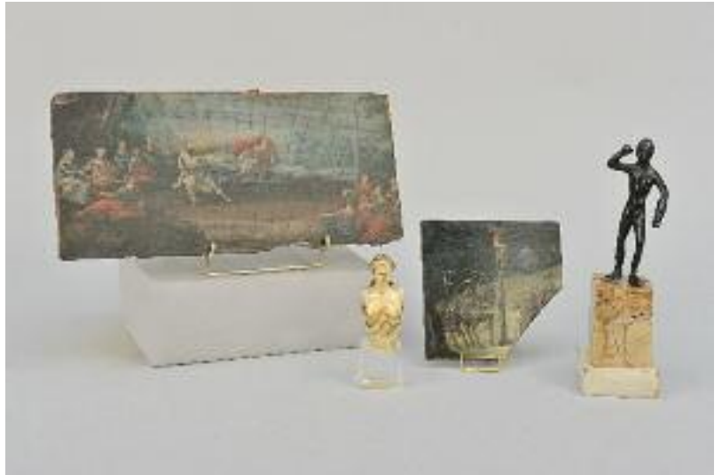
ECOLE FRANCAISE fin XVIIe siècle « Scène allégorique » Projet d'éventail sur panneau de bois. (petits manques) 13,5 x 28 cm 300/400