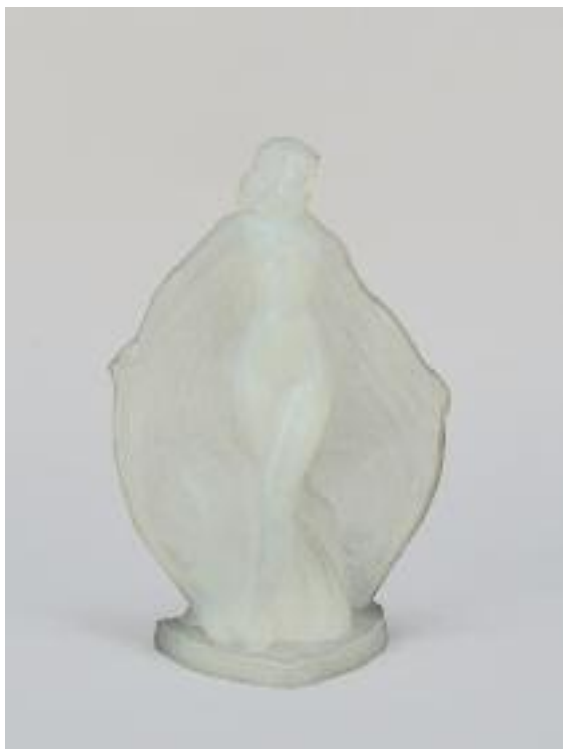
Ernest-Marius SABINO (1878-1961) « Joséphine BAKER ». Sculpture en verre opalescent moulé-pressé. Signé SABINO à l'arrière. Vers 1925. (un infime éclat à la base) H. 24 cm