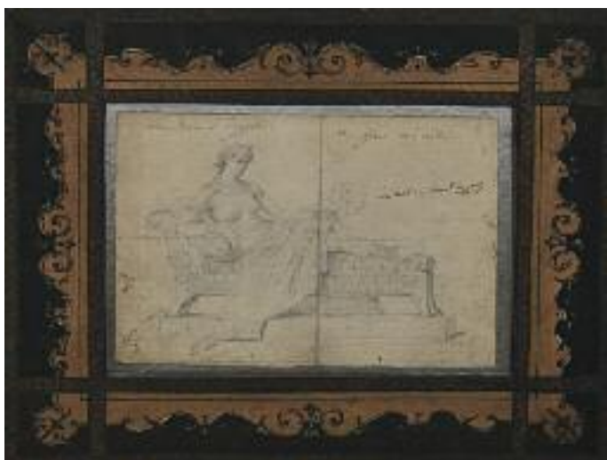
Charles LEPEC (1830-?)