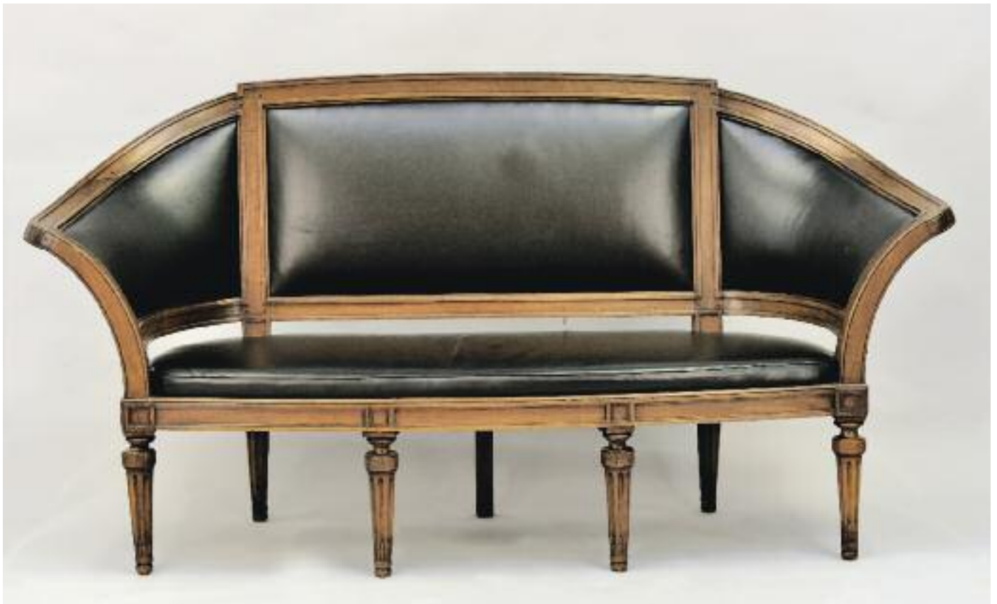
LARGE CANAPÉ en noyer mouluré et sculpté à dossier droit rectangulaire et accotoirs évasés. Il repose sur sept pieds fuselés, cannelés et rudentés. Travail Lyonnais d'époque Louis XVI Recouvert de cuir noir. (restaurations, pieds antés) H. 98 L. 160 P. 64 cm