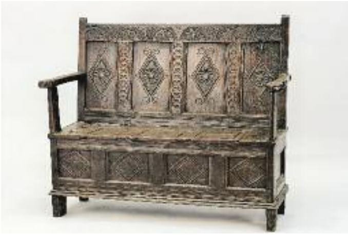
COFFRE À SEL OU CANTOU en chêne sculpté à décor de plis de serviette et fleurons, Rions-es-Montagne, XVII e siècle H. 108 L. 130. P. 60 cm 2 500/3 000