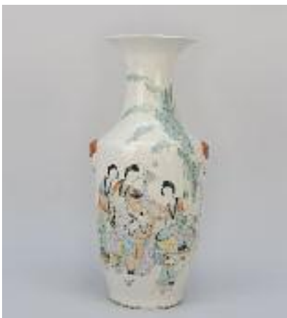
CHINE - Grand vase oblong en porcelaine blanche à décor sur une face de femme et enfants et au revers d'un texte en caractère chinois. Deux anses à tête d'animal. XIXe siècle. H. 57 cm 500/600