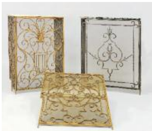
TROIS CACHES-RADIATEUR en fer forgé formant console à décor de vase fleuris et arabesques. Ouvre en façade. Dessus de marbre. Dans le goût de PIGUET, vers 1940 H. 111 L. deux 80 et une 90 cm. P 34 et 38 cm