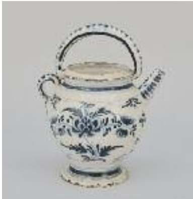
LYON – Gargoulette en faïence blanc bleu à décor de fleurs. Anse sur le dessus petite prise sur le côté et bec verseur. XVIIIe siècle. H. 29 cm 300/400