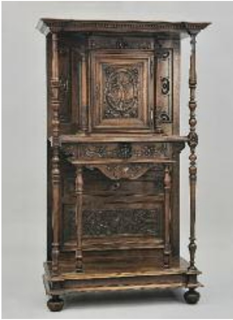
CABINET ARCHITECTURÉ À COLONNES en bois finement sculpté à colonnes et décor de cupidon et rinceaux. Il ouvre à un vantail et un tiroir. Style Renaissance. H. 165 L. 98 P. 51 cm 500/600