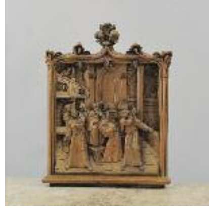
BAS RELIEF , «Le moine puni » Sculpture en bois, taille directe. 62 x 48 cm 100/120