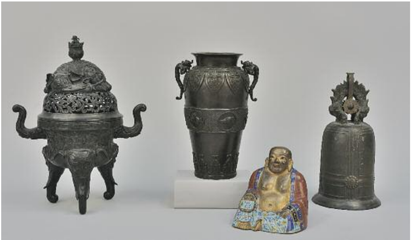
CHINE - Brûle parfum en bronze ciselé et patiné à décor d'éléphants. Deux prises à décor de trompes. Repose sur un piétement tripode. H. 41 cm 2 000/3 000