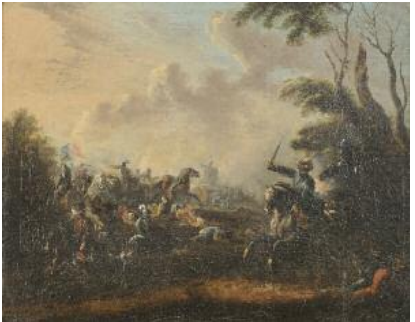
SCULPTURE représentant Hercule en bronze patiné noir reposant sur une base en marbre. Travail européen ancien. (petit accident à un pied) H. 11 cm 1 000/1 200 Pour un exemplaire similaire, voir « Les bronzes de la couronne » Edition RNM, Louvre, page 112.