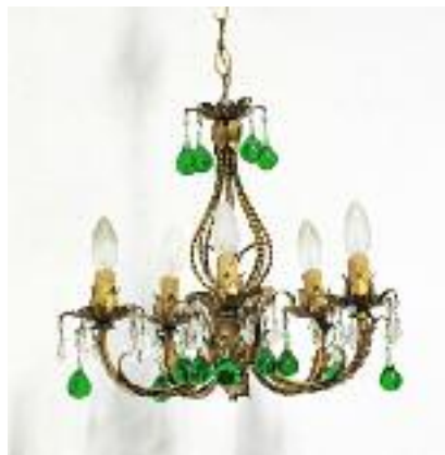
LUSTRE en fer forgé doré à cinq lumières à décor de pampilles et gouttes vertes. Vers 1950. H. 40 cm