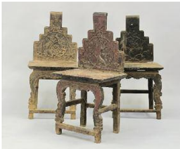
CHINE - Six chaises en bois sculpté. Dossier à décor d'arbres et oiseaux. Pieds avant sculptés de feuilles d'acanthes. Travail ancien. H. 106 L. 51 P. 42 cm 1 200/1 600