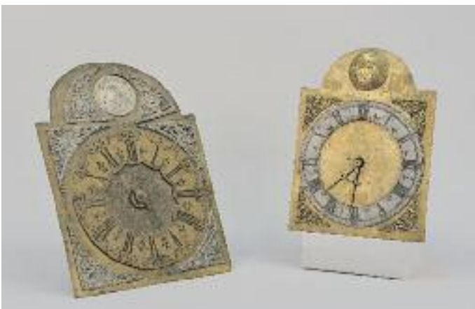
MOUVEMENT D'HORLOGE À SONNERIE (deux cloches). Cadran en laiton et acier. Signé sur le fronton P. DUREUX à DOUAY. XVIII e siècle. H. 34 cm 600/700