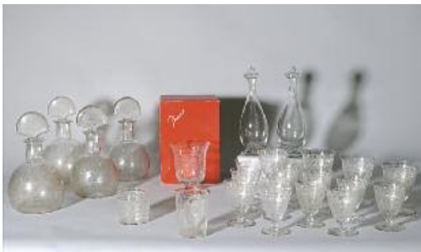
BACCARAT - Quatre carafes et leurs bouchons en cristal gravé à décor de rinceaux. Signées. H. 24,5 cm