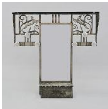
PATÈRE en fer forgé à décor de biches et entrelacs ouvrant à un tiroir recouvert d'un plateau de marbre vert Dans le goût de PIGUET ou ZADOUNAISKI. Vers 1930. H. 101 L. 100 P. 24 cm 350/400

La Maison de Ventes PALAIS SVV vous accueille chaque mardi après-midi pour des ventes courantes de tableaux, meubles et objets d'art (exposition le mardi matin de 10h à 12h).